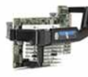
Adaptador HP FlexFabric 630FLB de 20 GB y 2 puertos