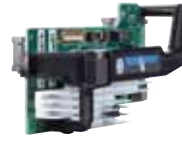
Adaptador HP Ethernet 570FLB de 10 GB y 2 puertos