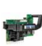
Adaptador HP FlexFabric 650FLB de 20 GB y 2 puertos