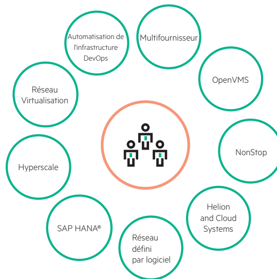
Figure 2 - Les centres d'expertise HPE (CoE) et votre expérience de support technique de bout en bout

Pour toute question relative à un incident et pour vos besoins en conseils et en coaching, vous pouvez accéder très rapidement aux experts des centres d'expertise HPE (CoE). Notre expérience sur le terrain nous aide à comprendre très rapidement vos objectifs, vos systèmes et vos solutions. Nous pouvons assurer l'orchestration de votre livraison de services, collaborer activement avec d'autres prestataires de support technique et prendre le contrôle de chaque situation à travers des pratiques de résolution de problème très efficaces.