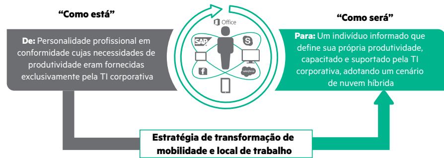
Figura 1: HPE Workplace e Mobility Transformation